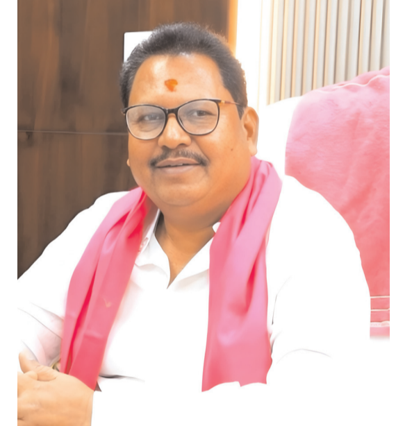
వినకుండా క్రూరంగా ప్రవర్తించారని ఆరోపించారు. బాధితులు ఇచ్చిన ఫిర్యాదును పట్టించుకోకుండా బాధితులపైనే కేసు నమోదు చేయడం దుర్భాగమని