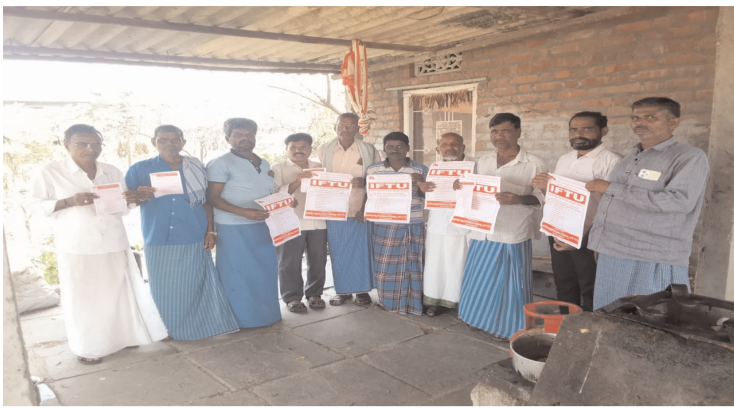
భారత కార్మిక సంఘాల సమైక్య ఐఎఫ్ఐయూ

గీతంలో నిర్వహించిన ముఖాముఖలో వజ్ర ఆటోమేషన్ పూర్వ సీఈవో వెల్లడి