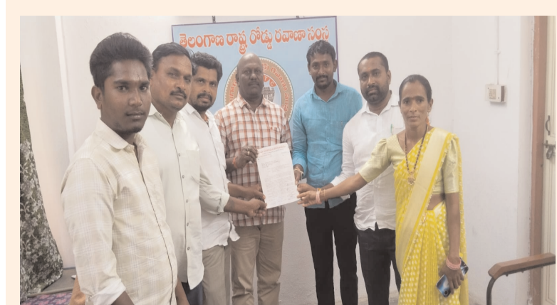
దాచారం టు కనేకల్ మీదుగా నడుమనూరుకు బస్సు సౌకర్యం కల్పించాలని నల్గొండ ఆర్టీసీ డిపో మేనేజర్ కు 6 గ్రామాల సర్పంచుల వినతి పత్రం లంబించడం జరిగింది