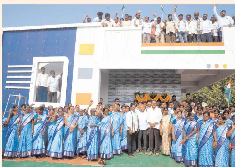
ఇందిరమ్మ ఇళ్లను ప్రారంభించిన ఎమ్మెల్యే బిఎల్ఆర్, ఎమ్మెల్సీ శంకర్ నాయక్