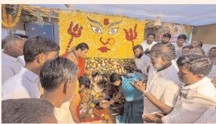
తునికి నల్ల పోచమ్మ తల్లి జాతరకు హాజరైన సర్పాహార్ ఎమ్మెల్యే సునీత లక్ష్మారెడ్డి.