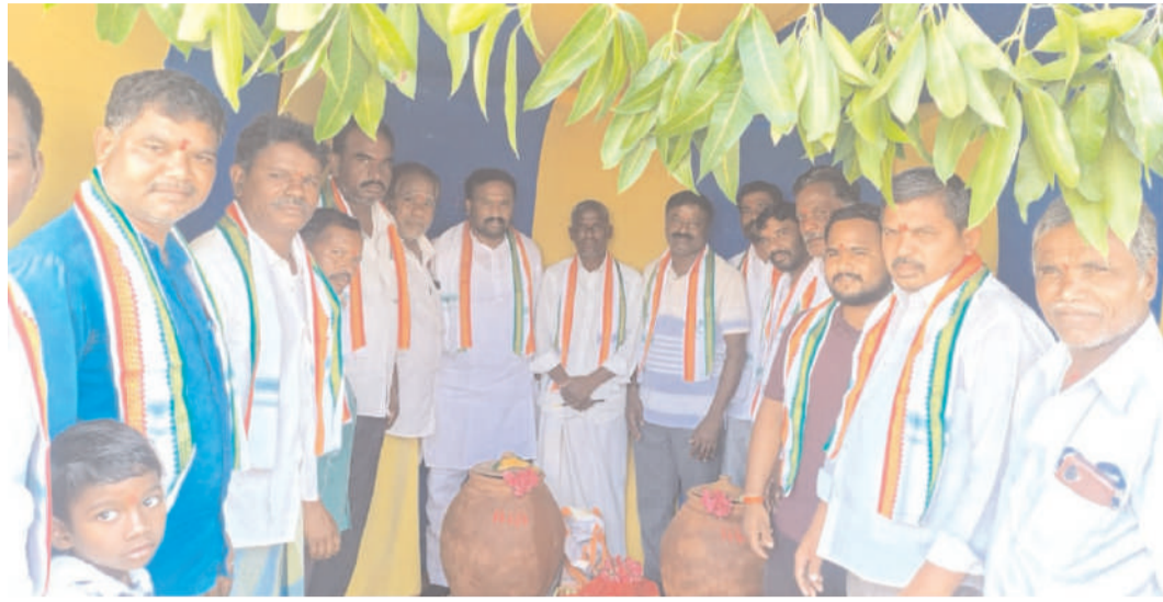
రాంరెడ్డిపల్లిని ఆదర్శ గ్రామంగా తీర్చిదిద్దడమే నా లక్ష్యం అని సర్పంచ్ పేర్కొన్నారు. సర్పంచ్ పాలకవర్గం చేస్తున్న ఈ పనులపై గ్రామ ప్రజలు హర్షం వ్యక్తం చేస్తూ, ఇతర గ్రామాలకు వీరు స్ఫూర్తిగా నిలుస్తున్నారని గ్రామ ప్రజలు కొనియాడారు. ఈ కార్యక్రమంలో కాంగ్రెస్ నాయకులు, కార్యకర్తలు, గ్రామ ప్రజలు తదితరులు పాల్గొన్నారు.