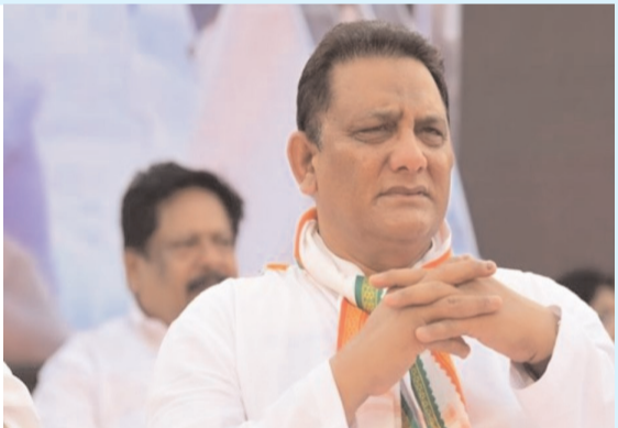
అజారుద్దీన్ మంత్రి పదవి ఉంటుందా?