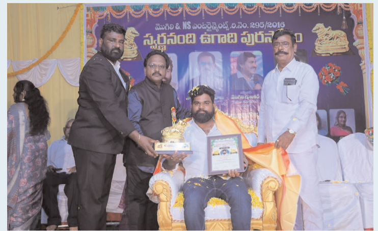
ఫోటోగ్రఫీలో స్వర్ణ నంది ఉగాది