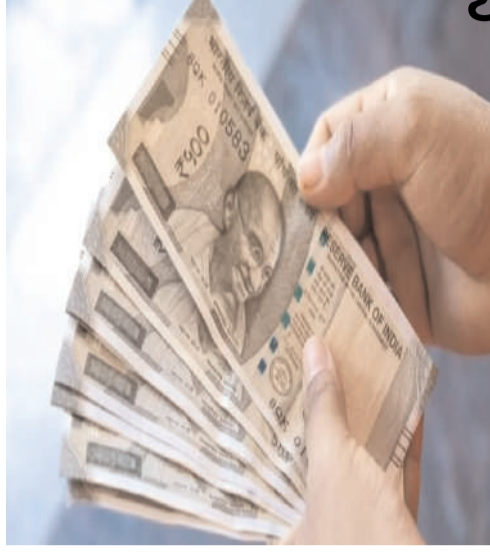
సపోర్ట్ యాక్ట్ (టీఈఎంఎఫ్ఎస్)- 2026 అనే పేరుతో