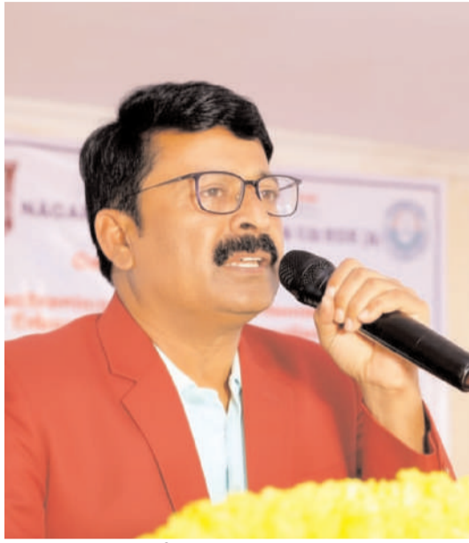
విలువ ఉండదు” అని నానుడి ఇక్కడ నిజమవుతుంది.

“జ్ఞానానికి విలువ లేని సమాజంలో, జ్ఞాన సంరక్షకులకు