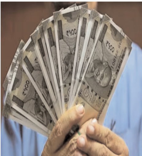
ప్రభుత్వం ఉండని తెలుస్తోంది. 42.7 లక్షల మందికి పించన్న..

2024 సామాజిక సర్వే లెక్కల ప్రకారం తెలంగాణ రాష్ట్రంలో ప్రస్తుతం 42.7 లక్షల మందికి పించన్న అందుతోంది. ఇందుకోసం ప్రతి నెలా రూ.950 కోట్ల వరకు ప్రభుత్వం ఖర్చు చేస్తోంది. ఈ పించన్న ను ప్రస్తుతానికి రూ.500 చొప్పున పెంచితే.. నెలకు సుమారు రూ.210 కోట్లు అదనంగా అవసరమవుతాయి. అంటే ఏడాదికి రూ.2500 కోట్లకు పైగా ఖరచు ప్రభుత్వంపై పడనుంది. దీనిపై తుది నిర్ణయానికి వచ్చాక బడ్జెట్లో కూడా ప్రస్తావించే అవకాశాలున్నాయి. తొలి విడతలో పెంచాలని ఛాన్సిస్ట్రు మొత్తాన్ని కూడా కలిపి బడ్జెట్లో కేటాయింపులు చేయనుట్లు తెలుస్తోంది. కాగా, దివ్యాంగుల ఫింఛన్