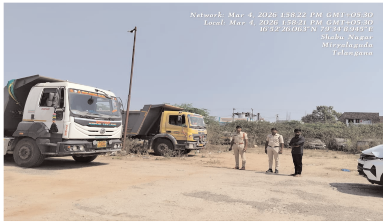
Network: Mar 4, 2026 1:58:22 PM GMT+05:30 Local: Mar 4, 2026 1:58:21 PM GMT+05:30 16:52:20:05 N 77:13:09 E Shibu Nagar Miryalaguda Telangana