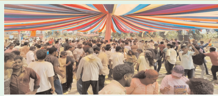
ఖమ్మంలో ఉత్సాహభరితంగా సాగిన రాంగ్ దే 26 హోలీ వేడుకలు

అదే నిర్లక్ష్యం, వైఫల్యం కొట్టొచ్చినట్లు కనబడుతుందని వెల్లడించారు. సిద్దిపేట జిల్లా, నంగునూరు మండలం, ఆరేపల్లి (అక్కెనపల్లి) గ్రామంలో సుమారు 350 ఎకరాల్లో మక్క సాగు చేస్తున్న రైతులు ప్రతి ఏటా నష్టపోతున్నా ప్రభుత్వం పట్టించుకోకపోవడం శోచనీయమన్నారు. దీంతో రైతులు ప్రైవేట్ వ్యాపారులకు తక్కువ ధరకు అమ్మి వస్తోందని అన్నారు. అనేక జిల్లాల్లో కొనుగోలు కేంద్రాలు ఆలస్యంగా ప్రారంభమవడం, అసలు ఏర్పాటు చేయకపోవడం, చెల్లింపులు ఆలస్యం కావడం, రవాణా సదుపాయాల లేమి వంటి సమస్యలు రైతులను ఆర్థికంగా కుదేలు చేస్తున్నాయని హలీష్ రావు పేర్కొన్నారు. కొనుగోలు కేంద్రాలు ఏర్పాటు చేసి, మద్దతు ధర చెల్లించి మక్కలు కొనుగోలు చేయాలని ప్రభుత్వాన్ని డిమాండ్ చేశారు.