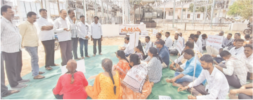
విద్యుత్ ఆర్టికల్స్, పీస్ రేట్ కార్డులకు రెండవ రోజు కొనసాగిన సమ్మె

మునుగోడు నియోజకవర్గం అభివృద్ధి కోసం నిస్వార్థంగా నిజాయితీగా పని చేస్తున్నానని.. ఇటీవల కొంతమంది తమ స్థాయికి మించి మాట్లాడుతున్నారని రాజకీయాల్లో ఉన్నప్పుడు రాజకీయాలు మాట్లాడుకోవాలి రాజకీయాలు లేనప్పుడు అభివృద్ధి మీదనే దృష్టి పెట్టాలని అన్నారు... మునుగోడు నియోజకవర్గం లో స్వాతంత్ర్యం వచ్చిన నాటి నుండి ఇప్పటివరకు 31 నల్ స్టేషన్లు నిర్మాణం అయితే... మా ప్రజా ప్రభుత్వం వచ్చిన ఈ రెండు సంవత్సరాలలోనే 24 నల్ స్టేషన్లు మంజూరయ్యాయని . ప్రస్తుతానికి 132 కెవి నల్ స్టేషన్ లు మూడు ఉండగా.. మరో మూడు 132 కెవి నల్ స్టేషన్లు మంజూరు చేయించాను అన్నారు... రాజీయే 25 30 సంవత్సరాలను దృష్టిలో పెట్టుకొని మునుగోడు నియోజకవర్గంలో లోవో బ్రిజ్ సమస్య లేకుండా చూడడానికి అహర్నిశలు కృషి చేస్తున్నామన్నారు..