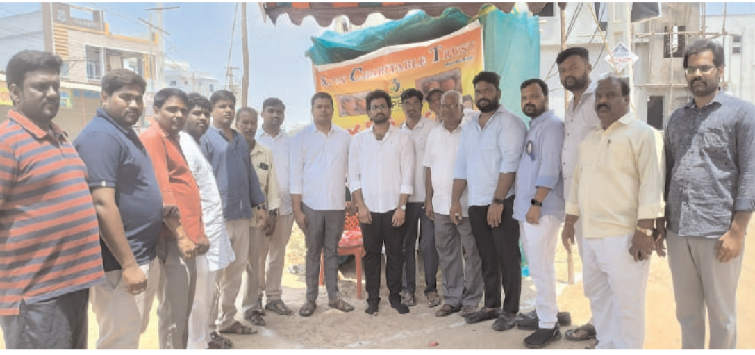
బి.ఆర్. అంబేద్కర్ స్మారకానికి ఈ సంస్థను స్థాపించామని తెలిపారు. సేవా కార్యక్రమాలే ప్రధాన లక్ష్యంగా ముందుకు సాగుతూ భవిష్యత్తులో మరిన్ని సామాజిక సేవలు చేపడతామని చెప్పారు. వేసవి కాలం ముగిసే వరకు చలివేంద్రం కొనసాగుతుందని వెల్లడించారు. ఈ కార్యక్రమంలో ప్రజలు, స్థానిక ప్రజలు మరియు అరతి నగర్ కాలనీ వాసులు పాల్గొన్నారు.