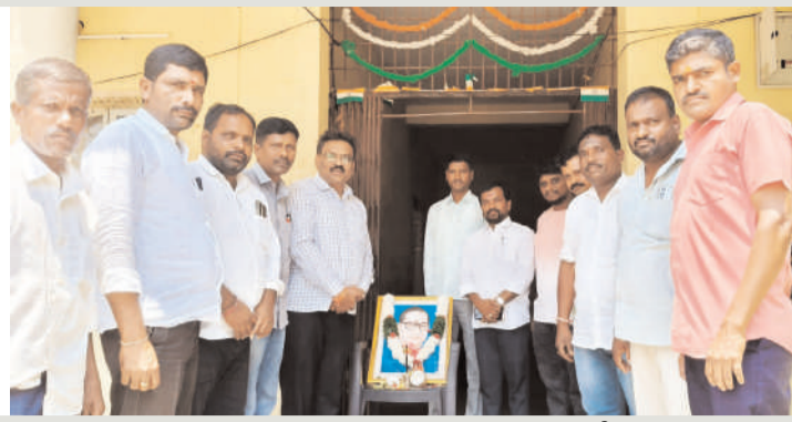
తుర్కపల్లి తహసీల్దార్ కార్యాలయం లో ఘనంగా డాక్టర్ భీమ్ రావు అంబేద్కర్ గారి 135 వ జయంతి.