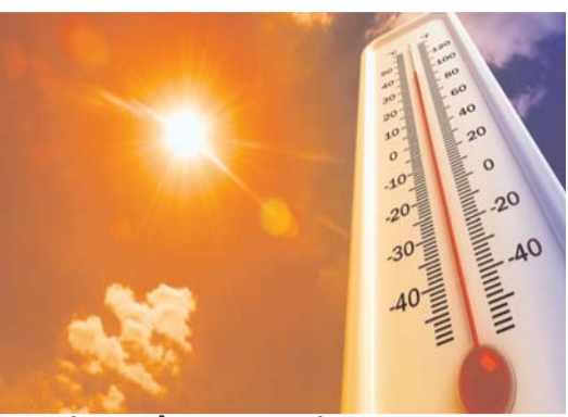
ఎండ తీవ్రత వివేకంగా ఉంటుంది. ఉక్కుపోత వాతావరణం పెరిగి రాత్రిపూట కూడా ఉష్ణోగ్రతలు తగ్గడం లేదు. మార్చి చివరి నుంచి సాధారణం కంటే అధిక ఉష్ణోగ్రతలు నమోదవుతున్నాయి. ఏప్రిల్ మొదటి వారంలో కొన్ని ప్రాంతాల్లో వర్షాల వల్ల కొంత ఉపశమనం లభించినప్పటికీ, ఎండలు మళ్లీ తీవ్రరూపం

హైదరాబాద్, ప్రభాత సూర్య: తెలంగాణలో రోజు రోజుకీ ఉష్ణోగ్రతలు పెరుగుతున్నాయి. ఏప్రిల్ చివరి నాటికి ఉష్ణోగ్రతలు మరింతగా పెరిగే అవకాశం ఉందని వాతావరణ శాఖ అంచనా వేసింది. ఏప్రిల్ తెలంగాణలో ఎండలు తారెత్తిస్తున్నాయి. ఉదయం నుంచే భానుడు భగభగమంటున్నాడు. వివిధ పనులు కోసం బయటకు వెళ్లిన ప్రజలు ఎండవేడిమి తట్టుకోలేక ఆపసోపాలు పడుతున్నారు. శనివారం కుమురంభీం జిల్లా కెరిమెరిలో అత్యధికంగా 44.6 డిగ్రీల ఉష్ణోగ్రత నమోదైంది. నిజామాబాద్ జిల్లా మెండోరలో 44.5 డిగ్రీలు, జగిత్యాల జిల్లా ఎండవల్లిలో 44.4 డిగ్రీల ఉష్ణోగ్రతలు నమోదైనట్లు హైదరాబాద్ వాతావరణ కేంద్రం వెల్లడించింది. రోజు రోజుకూ ఎండలు పెరుగుతున్న నేపథ్యంలో చిన్నారలు, వృద్ధులు తగిన జాగ్రత్తలు తీసుకోవాలని, అత్యవసరమైతే తప్ప బయటకు వెళ్లొద్దని వాతావరణ శాఖ సూచించింది. ఉదయం నుంచే