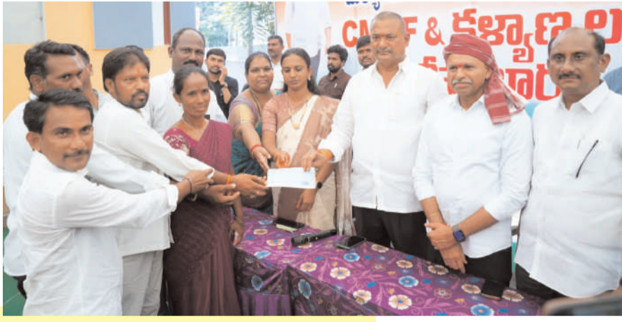
రూ.2.55కోట్లవిలువ గల చెక్కులు పంపిణీ

మిర్యాలగూడ ఏప్రిల్ 6:- (ప్రభాత సూర్య): తెలంగాణ రాష్ట్ర ప్రభుత్వం ప్రతిష్టాత్మకంగా చేపట్టిన సన్నబియ్యం పంపిణీ పథకం విజయవంతంగా ఏడాది పూర్తి చేసుకున్న సందర్భంగా మిర్యాలగూడ నియోజకవర్గంలో పండుగ వాతావరణం నెలకొంది. ఎమ్మెల్యే బత్తుల లక్ష్మారెడ్డి బిఎల్ఆర్ ఆధ్వర్యంలో స్థానిక ఎమ్మెల్యే క్యాంపు కార్యాలయంలో వినుత్తుంగా సన్నబియ్యం వార్షికోత్సవ వేడుకలను నిర్వహించారు. సన్నబియ్యం పథకం ద్వారా పేద ప్రజలకు అందుతున్న మేలును చాటిచెప్పేలా ఎమ్మెల్యే బిఎల్ఆర్ సోమవారం ఎమ్మెల్యే క్యాంపు కార్యాలయంలో సహపత్రి భోజనం ఏర్పాటు చేసి స్వయంగా వడ్డించారు. అనంతరం తన కుటుంబ సభ్యులతో కలిసి సామాన్య లబ్ధిదారుల,