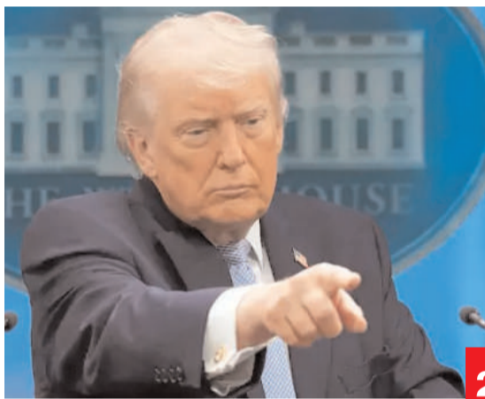
అమెరికా అధ్యక్షుడు ట్రంప్ ప్రకటించారు. ఇరాన్ -అమెరికా, ఇజ్రాయేల్ దేశాల

హర్యాణ్ పై సుంకాలు విధింపును సమర్థించుకున్న ఇరాన్ కాల్పుల విరమణతో ప్రపంచ శాంతి ఇదో గొప్ప సుదినమంటూ ట్రంప్ పోస్ట్ ఇరాన్ నుంచి సురక్షితంగా వీడండి భారత ప్రజలకు కేంద్రం అధ్యయజిర్