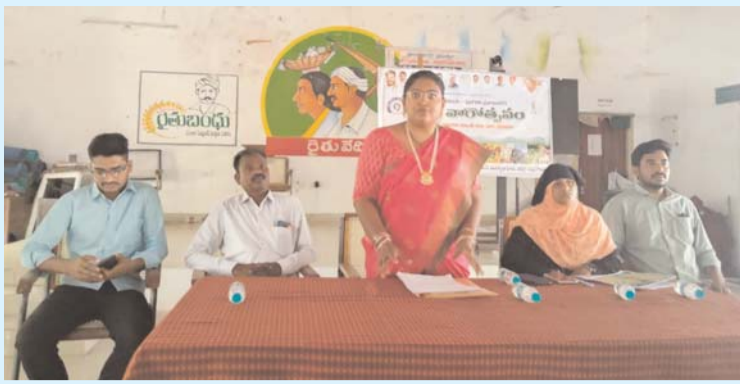
ప్రజాపాలన ప్రగతి ప్రణాళికలో భాగంగా రైతు వారోత్సవాలు