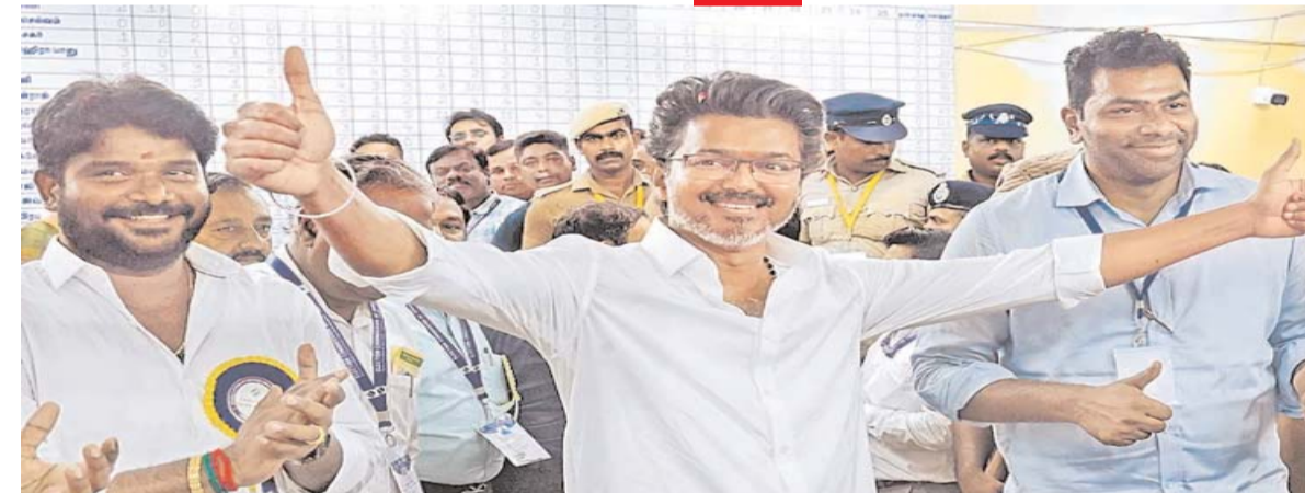
హైదరాబాద్: నాలుగు రాష్ట్రాలు, ఒక కేంద్రపాలిత ప్రాంతానికి గత నెలలో జరిగిన ఎన్నికల ఫలితాలు సోమవారం విడుదలయ్యాయి. మెజారిటీ ఎగ్జిట్ పోల్స్ అంచనాలను తలకిందులు చేస్తూ నలుగురు విజయ నేతృత్వంలోని టీవీకే పార్టీ తమిళనాడులో అతిపెద్ద పార్టీగా అవతరించింది. మొత్తం 234 స్థానాల్లో 107 సీట్లను గెలుచుకొని విజయ ధంకా మోగించింది. అధికార డీఎంకే కూటమి 74 స్థానాలకు పరిమితమయ్యింది.