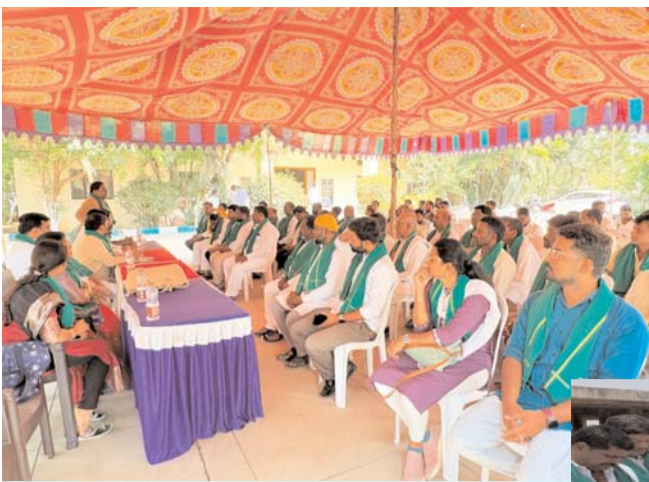
వ్యవసాయ మార్కెట్ అభివృద్ధి పనులకు శ్రీకారం