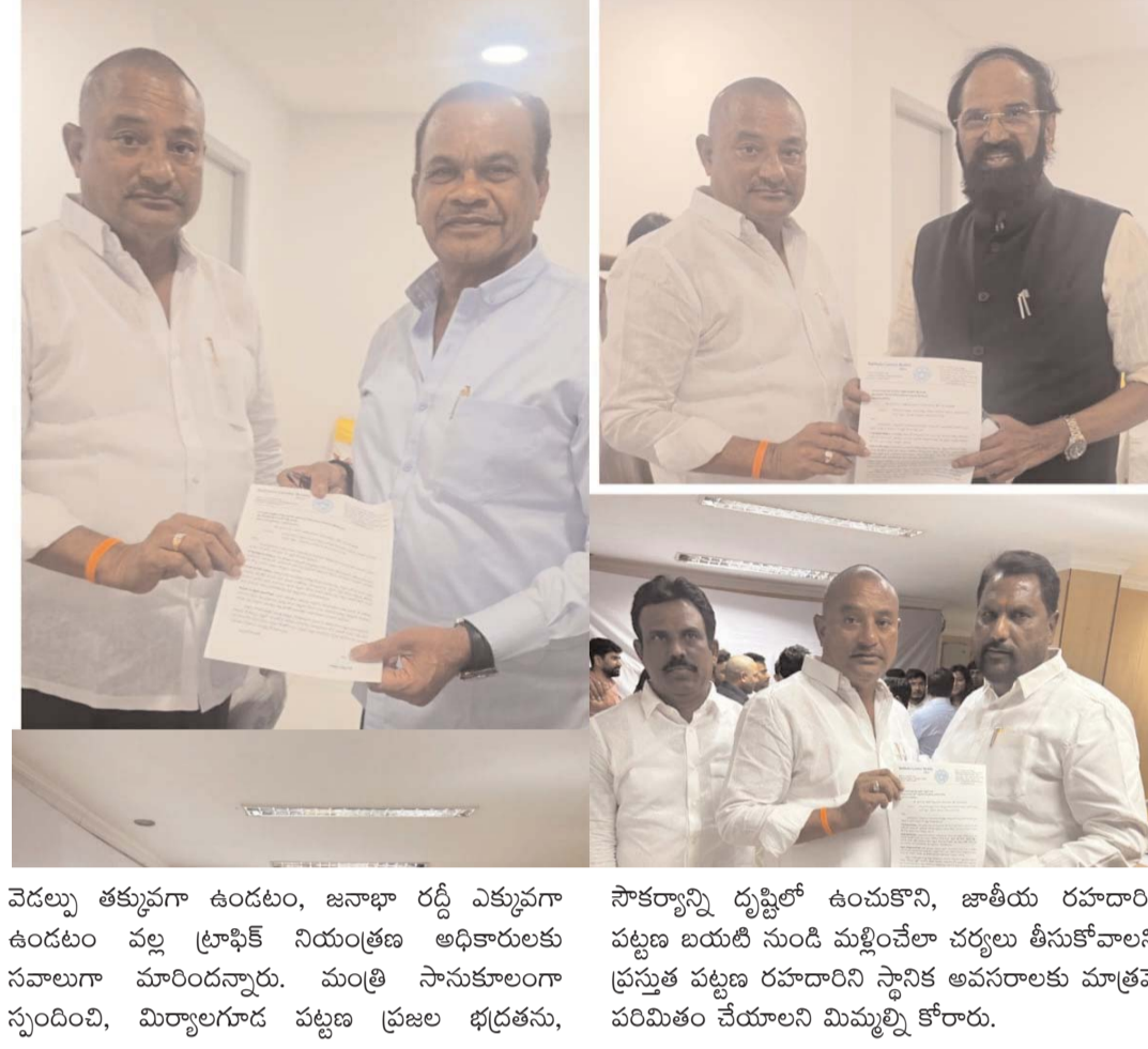
వెదల్చు తక్కువగా ఉండటం, జనాభా రద్దీ ఎక్కువగా ఉండటం వల్ల ట్రాఫిక్ నియంత్రణ అధికారులకు సవాలుగా మారిందన్నారు. మంత్రి సానుకూలంగా స్పందించి, మిర్యాలగూడ పట్టణ ప్రజల భద్రతను, సౌకర్యాన్ని దృష్టిలో ఉంచుకొని, జాతీయ రహదారిని పట్టణ బయటి నుండి మళ్లించేలా చర్యలు తీసుకోవాలని, ప్రస్తుత పట్టణ రహదారిని స్థానిక అవసరాలకు మాత్రమే పరిమితం చేయాలని మిమ్మల్ని కోరారు.