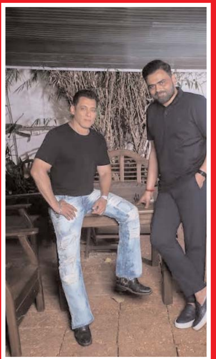
లక్ష్యంగా ముందుకు సాగుతున్న ఈ సినిమా, సల్మాన్ ఖాన్ కెరీర్ లో మరో విజయవంతమైన చిత్రంగా నిలుస్తుందా అన్నది ఆసక్తికరంగా మారింది. కాగా, గత కొన్నాళ్ళుగా సల్మాన్ ఖాన్ హిట్స్ అందించలేక నిరాశలో ఉన్నారు. టాలీవుడ్ డైరెక్టర్ తో చేస్తున్న సినిమాతో అయిన మంచి హిట్ అందుకుంటాడా అనేది చూడాలి.