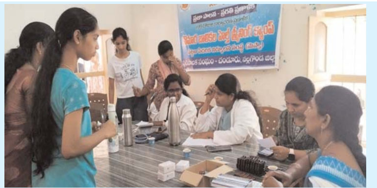
బాలికలకు ఉచిత హెల్త్ స్క్రీనింగ్ క్యాంప్..