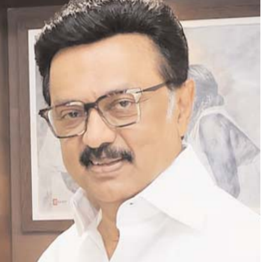
మీడియాలో జోరుగా సాగుతోంది. సంప్రదాయ ఓటు బ్యాంకుతోపాటు డీఎంకేకు గట్టిపట్టున్న నియోజకవర్గం ఇది. అందుకే గ్రౌండ్ వర్క్ కు ప్రిపేర్ అవుతున్నట్లు తెలుస్తోంది. ప్రస్తుతం తమిళనాడులో విజయ్ హవా నడుస్తోంది. అయితే బై పోల్స్ మరో ఆరు నెలల తర్వాత జరిగే అవకాశం ఉంది. అప్పటికి ఇదే పరిస్థితి ఉంటుందా లేదా అనే అనుమానం కూడా ఉంది.

మొన్నటి ఎన్నికల తరువాత ఒక ఎత్తు.. అధికారం కోసం ఇతర పార్టీలతో కలిసిన తరువాత మరో ఎత్తు అన్నట్లు ఉంది విజయ్ ఇవేజే పరిస్థితి. అందుకే స్టాలిన్ పట్టు బిగిస్తున్నట్లు అర్థం అవుతోంది.