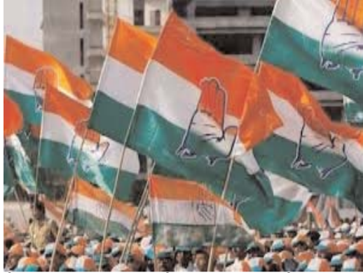
కొరిన సంగతి తెలిసిందే. ఇప్పుడు మరోసారి తన ప్రయత్నాలు ముమ్మరం చేసేందుకు ఢిల్లీ బాట పట్టారు. అయితే తెర వెనుక చాలామంది నేతలు ఢిల్లీ వెళ్లి పెద్దలను కలుస్తున్నట్లు తెలుస్తోంది.

మరో డిప్యూటీ సీఎం... మరో బీసీమంత్రికి డిప్యూటీ