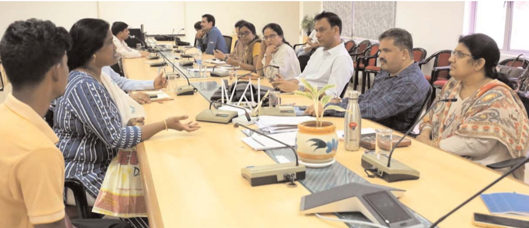
ఫోలోఅప్, పౌరుల సంతృప్తికి ప్రాధాన్యత ఇస్తూ సైబరాబాద్ వ్యాప్తంగా సేవల నాణ్యతను మరింత మెరుగుపర్చేందుకు క్రమం తప్పకుండా సమీక్షలు నిర్వహించనున్నట్లు అధికారులు వెల్లడించారు.

మాదాపూర్ ప్రభాత సూర్య : సైబరాబాద్ నగర పాలక సంస్థ అధ్యక్షులలో నిర్వహించిన 'సోమవారం ప్రజావాణి' కార్యక్రమంలో పౌరుల నుంచి మొత్తం 80 ఫిర్యాదులు స్వీకరించి సంబంధిత విభాగాలు క్షుణ్ణంగా సమీక్షించాయి. టౌన్ ప్లానింగ్, ఇంజనీరింగ్, పారిశుధ్యం, రెవెన్యూ, విజిలెన్స్ తదితర అంశాలకు సంబంధించిన సమస్యలను పౌరులు నేరుగా అధికారుల దృష్టికి తీసుకెళ్లగా, ప్రతి ఫిర్యాదుకు ప్రత్యేక ట్రాకింగ్ ఐడీ కేటాయించి రశీదులు అందజేశారు. ఫిర్యాదుల పరిష్కారంలో పారదర్శకత, జవాబుదారీతనం ఉండేలా చర్యలు చేపట్టిన అధికారులు పెండింగ్ సమస్యలను నిర్ణీత గడువులోగా పరిష్కరించాలని సంబంధిత విభాగాలకు ఆదేశాలు జారీ చేశారు. క్షేత్రస్థాయిలో విభాగాల సమన్వయం పెంచుతూ నిరంతర పర్యవేక్షణ కొనసాగించాలని, ప్రజలకు స్పష్టమైన మార్పు కనిపించేలా వెంటనే చర్యలు చేపట్టాలని సూచించారు. ఫిర్యాదుల సమర్థవంతమైన పరిష్కారం, నిరంతర