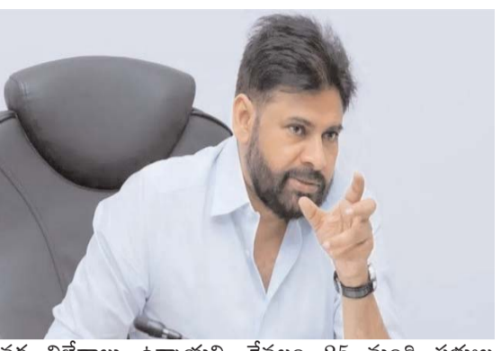
వర్గ విభేదాలు ఉన్నాయని, కేవలం 25 మంది సభ్యుల మధ్య ఏకంగా 54 గౌరవలు ఉన్నాయని పవన్ కల్యాణ్ ఆవేదన వ్యక్తం చేశారు. అంతర్గత కలహాలతో ఒకరినొకరు

జనసేన పార్టీలో తన పుష్కర కాలం నాటి సహనానికి స్పష్టి పలుకుతున్నానని, ఇకపై పార్టీలో క్రమశిక్షణ తప్పితే ఉపేక్షించేదీ లేదని జనసేన అధినేత, ఉప ముఖ్యమంత్రి పవన్ కల్యాణ్ తీవ్ర స్వరంతో హెచ్చరించారు. పార్టీని ఒక సైనిక పటాలంలా ముందుకు నడిపించేందుకు కఠిన నిర్ణయాలు తప్పవని స్పష్టం చేశారు. రాజమండ్రిలో జరిగిన పార్లమెంటరీ స్థాయి నాయకులు, కార్యకర్తల సమావేశంలో ఆయన మాట్లాడుతూ, పార్టీలో ప్రక్షాళనకు శ్రీకారం చుడుతున్నట్లు సంచలన ప్రకటన చేశారు. దీనికి తొలి అడుగుగా, అంతర్గత కలహాలతో సతమతమవుతున్న అంగీకరించిన తర్వాత ప్రపంచ చమురు ధరలకు ప్రాథమిక ప్రమాణమైన బెరల్ క్రూడ్ 5 శాతానికి పైగా పడిపోయింది. ఇలాంటి అమెరికా-ఇజ్రాయెల్ దాడులు, అలాగే కీలకమైన ప్రపంచ చమురు రవాణా మార్గమైన పెరుల్ జలసంధి గుండా నౌకాయానానికి అంతరాయం కలుగడంతో ఫిల్లిపర్ నెలాఖరు నుంచి ప్రపంచ ముడి చమురు ధరలు 50 శాతానికి పైగా పెరిగాయి. ఫిల్లిపర్ 28న యుద్ధం ప్రారంభమైస్తుంటే నుండి గృహోపయోగ వంటగ్యాస్ ధరను 14.2 కిలోల సీలింగర్ రూ. 60, కంప్రెస్డ్ నేచురల్ గ్యాస్(సీఎన్జీ) ధరను మే మధ్య నుండి కిలోకు రూ. 4 చొప్పున పెంచారు.