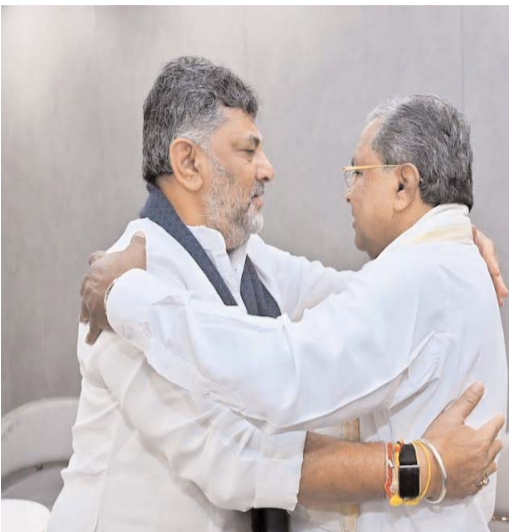
స్వీకరించారు. 1968 వరకు అంటే ఐదేళ్ల 345 రోజులు అధికారంలో కొనసాగారు. అదేపార్టీకి చెందిన డి. దేవరాజ్ అర్స్ 1972 నుంచి 1977వరకు, తర్వాత సిద్ధరామయ్య 2013 నుంచి 2018 వరకు పూర్తికాలం ముఖ్యమంత్రిలుగా కొనసాగారు. అయితే 1973 వరకు

బెంగళూరు: కర్ణాటకలో సీఎం మార్పుపై కొన్ని నెలలుగా సాగుతున్న ప్రచారానికి తెరపడింది. 2023లో ముఖ్యమంత్రి బాధ్యతలు స్వీకరించిన సిద్ధరామయ్య.. ఇప్పుడు ఆ కుర్చీని వదులుకోవడం ఖాయమయ్యింది. తన రాజీనామాను ఆయన గవర్నర్ కార్యదర్శికి అందచేశారు. దీంతో డి3 శివకూటర్ కు లైన్ క్షీయర్ అయ్యింది. ఎన్నికల ఫలితాల అనంతరం పార్టీ ఇచ్చిన మాట ప్రకారం.. డి3 కౌత్ సీఎంగా బాధ్యతలు స్వీకరించే అవకాశాలు కనిపిస్తున్నాయి. ఆయనే ఖరారయితే ఆయన పదవిలో రెండేళ్లు మాత్రమే ఉంటారు. అసలు కర్ణాటకలో పూర్తి పదవీకాలం సీఎం సీటులో కొనసాగడం ఒక ఘనత అనే చెప్పవచ్చు. 1956 నుంచి కేవలం ముగ్గురు నేతలు మాత్రమే పూర్తికాలం పదవిలో కొనసాగారు. కాంగ్రెస్ నేత ఎస్. నిజలింగప్ప రెండుసార్లు ముఖ్యమంత్రిగా పనిచేశారు. 1956లో ఏడాదికిపైగా ఆ పదవిలో ఉన్న ఆయన.. 1962లో మరోసారి ఆ బాధ్యతలు