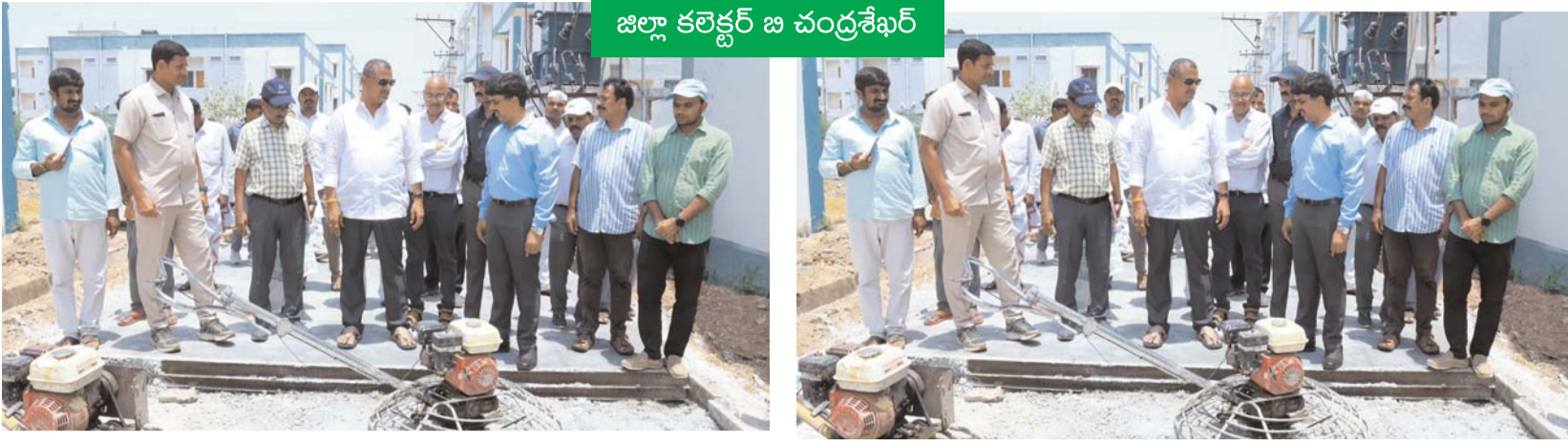
జిల్లా కలెక్టర్ జి చంద్రశేఖర్

మిర్యాలగూడ మే 28:- ప్రభాత సూర్య మిర్యాలగూడ డబుల్ బెడ్రూమ్ ఇళ్ల పనులు ఈ నెలాఖరులోగా పూర్తి చేయాలని జిల్లా కలెక్టర్ బి.చంద్రశేఖర్ ఆన్వారు. గురువారం ఆయన ఎమ్మెల్యే బత్తుల లక్ష్మారెడ్డి బిఎల్ఆర్ తో కలిసి మిర్యాలగూడ పట్టణంలోని శ్రీనివాస్ నగర్ గుమస్తాల కాలనీలో నిర్మించిన డబుల్ బెడ్రూమ్ ఇళ్లను పరిశీలించారు. జూన్ 2 నాటికి డబుల్ బెడ్రూమ్ ఇండ్లకు సంబంధించిన అన్ని పనులు పూర్తి చేసి లబ్ధిదారులకు ఇళ్లను అందజేసేలా చర్యలు తీసుకోవాలని ఎమ్మెల్యే బిఎల్ఆర్ అధికారులను కోరారు. అనంతరం మిర్యాలగూడ ఆర్.డి. కార్యాలయంలో డబుల్ బెడ్రూమ్