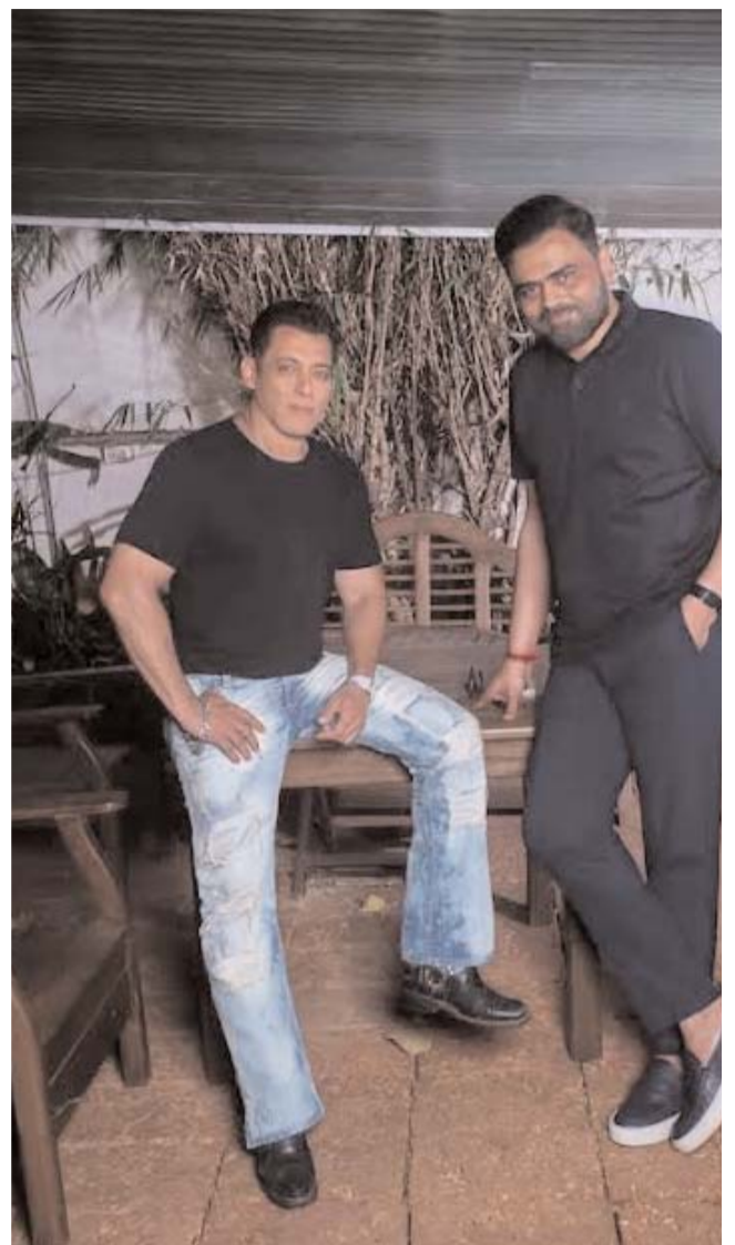
లక్షంగా ముందుకు సాగుతున్న ఈ సినిమా, సల్మాన్ ఖాన్ కెరీర్ లో మరో విజయవంతమైన చిత్రంగా నిలుస్తుందా అన్నది ఆసక్తికరంగా మారింది. కాగా, గత కొన్నాళ్లుగా సల్మాన్ ఖాన్ హిట్స్ అందించలేక నిరాశలో ఉన్నారు. బాలీవుడ్ డైరెక్టర్ తో చేస్తున్న సినిమాతో అయిన మంచి హిట్ అందుకుంటాడా అనేది చూడాలి.

పూజా కార్యక్రమాలతో ప్రారంభం బాలీవుడ్ స్టార్ హీరో సల్మాన్ ఖాన్, బాలీవుడ్ దర్శకుడు వంశీ పైడిపల్లి కాంబినేషన్ లో తెరకెక్కుతున్న భారీ చిత్రం అధికారికంగా ప్రారంభమైంది. ప్రముఖ నిర్మాత బిల్ రాజ్ నిర్మిస్తున్న ఈ సినిమా షూటింగ్ శుక్రవారం పూజా కార్యక్రమాలతో ప్రారంభమైంది. ఈ సందర్భంగా విడుదలైన ప్రత్యేక వీడియో సామాజిక మాధ్యమాల్లో విస్తృతంగా వైరల్ అవుతోంది. షూటింగ్ ప్రారంభమై స్పందించిన సల్మాన్ ఖాన్, ఈ భారీ యాక్షన్ ఎంటర్టైన్మెంట్ వచ్చే ఏడాది ఈడీ పండుగ సందర్భంగా ప్రేక్షకుల ముందుకు తీసుకురానున్నట్లు తెలిపారు. సినిమా విడుదలకు ఇంకా సమయం ఉన్నప్పటికీ నిరాశ చెందనట్లు మి అంచనాలకు తగ్గట్టుగానే ఈ సినిమా ఉంటుంది అని అభిమానులకు హామీ ఇచ్చారు. ప్రతి ఏడాది ఈడీ సందర్భంగా ఆయన సినిమాలు విడుదలై భారీ విజయాలు సాధించడం తెలిసిందే. ఈ సినిమాలో సల్మాన్ సరసన లేడీ సూపర్ స్టార్ నయనతార హీరోయిన్ గా నటిస్తున్నారు. తెలుగు చిత్రసీమలో విజయవంతమైన సినిమాలతో గుర్తింపు పొందిన వంశీ పైడిపల్లి ఈ సినిమాతో హిందీ చిత్రసీమలో అడుగుపెడుతున్నారు. సల్మాన్ ఖాన్ ఇమేజీకు తగ్గట్టుగా యాక్షన్, భావోద్వేగాల మేళవంపుతో కథ సిద్ధం చేసినట్లు సమాచారం. శ్రీ వెంకటేశ్వర క్రియేషన్స్, బ్యానర్ పై బిల్ రాజ్ ఈ చిత్రాన్ని అత్యంత భారీ వ్యయంతో నిర్మిస్తున్నారు. ఉన్నత సాంకేతిక ప్రమాణాలతో, ప్రేక్షకులను ఆకట్టుకునే యాక్షన్ సన్నివేశాలతో సినిమా రూపొందించుతున్నారని చెబుతున్నారు. బాలీవుడ్ స్టార్ హీరో, బాలీవుడ్ హిట్ దర్శకుడు కలయికలో వస్తున్న ఈ చిత్రం అభిమానుల్లో భారీ అంచనాలు రేకెత్తిస్తోంది. ఈడీ విడుదల