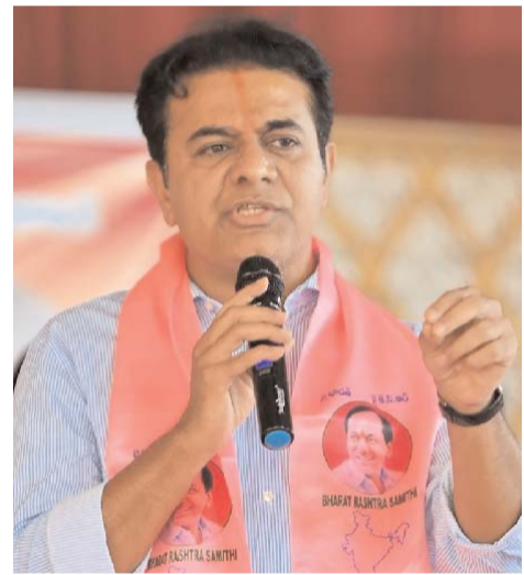
హైదరాబాద్ : హైదరాబాద్ నగరంలో జరిగిన ఎస్సీ, ఎస్టీ, బీసీ, మైనారిటీ కాంట్రాక్టర్ల అసోసియేషన్ నిర్వహించిన ధర్మాకు బిఆర్ఎస్ వర్కింగ్ ప్రెసిడెంట్ కేటీఆర్ మద్దతు తెలిపారు. ఈ సందర్భంగా ఆయన కాంగ్రెస్ ప్రభుత్వంపై తీవ్ర విమర్శలు చేస్తూ.. కాంట్రాక్టర్ల సమస్యలు, హామీలు అమలు తీరుపై ప్రశ్నలు లేవనెశారు. ప్రజలకు న్యాయం చేయడంలో ప్రభుత్వం

నారి సమస్యలు వెంటనే పరిష్కరించాలన్న కేటీఆర్