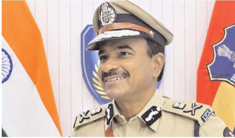
సూచించారు. టిక్డికల్ సేవల కోసం ప్రత్యేకంగా డిజిపి టెక్ టీమ్ను ఏర్పాటు చేసినట్లు తెలిపారు. ప్రతి జిల్లా ఎస్సీ, పోలీస్ కమిషనర్లు క్రైమ్ రివ్యూ తప్పకుండా నిర్వహించాలని, యూనిట్ హెడ్ అధికారులు ఆకస్మిక తనిఖీలు చేయాలని డిజిపి ఆనంద్ ఆదేశించారు.